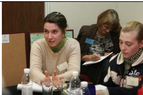
Участниците дискутират темата „Енергетика и околна среда”