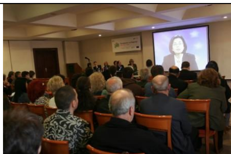
Българският комисар Меглена Кунева приветства участниците