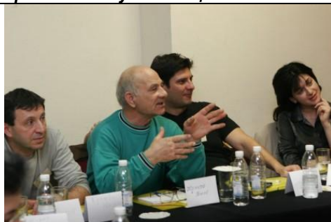
Дискусия в група