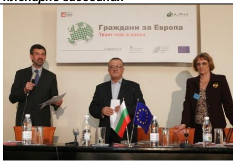
Евродепутатите Константин Димитров и Евгени Кирилов при закриване на дискусията