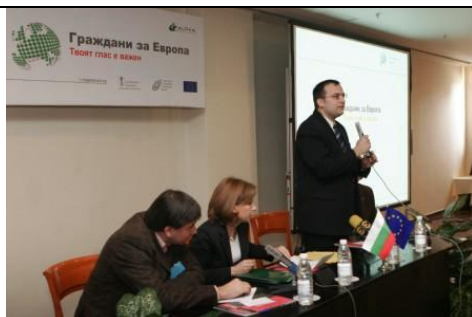
Българският евродепутат Мартин Димитров приветства участниците