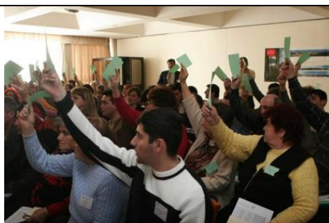
Участниците гласуват крайните резултати на пленарно заседание