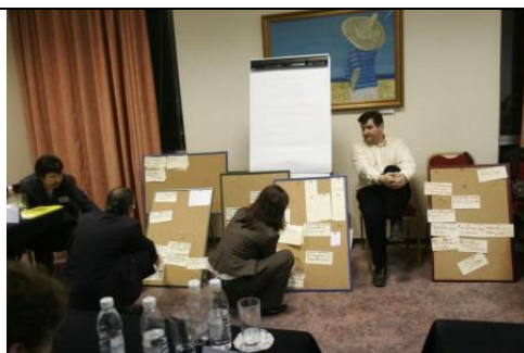
Участниците групират целите по тема „Енергетика и околна среда”